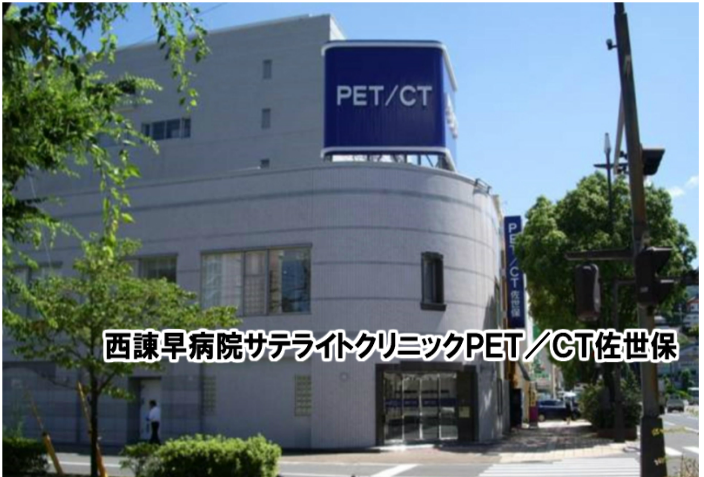
西諫早病院サテライトクリニックPET/CT佐世保