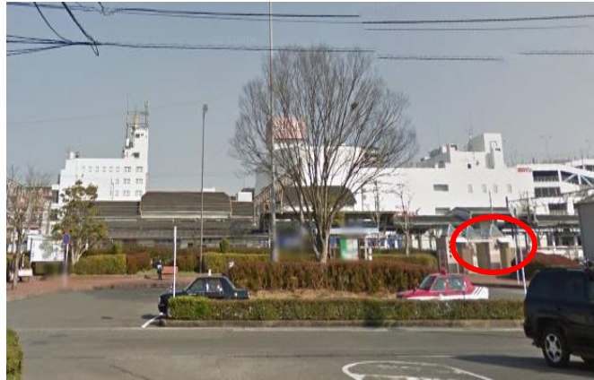
諫早駅裏(ロータリー)