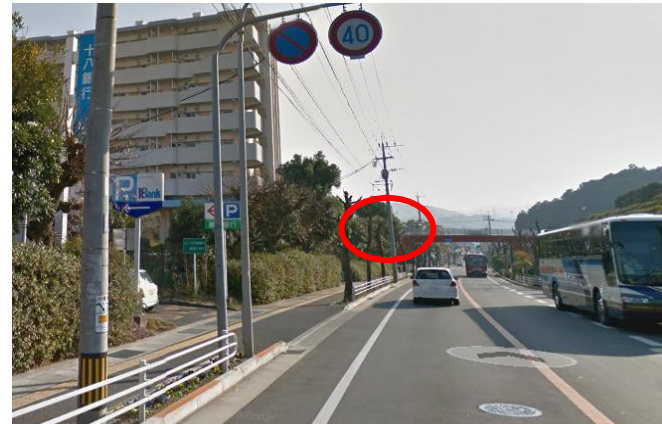
ニュータウン(地区センターバス停前)