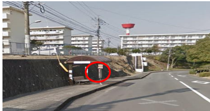
堂崎町(夕日ヶ丘バス停)